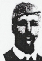
Spyridon LOUIS The First Marathon Champion of the Modern Games