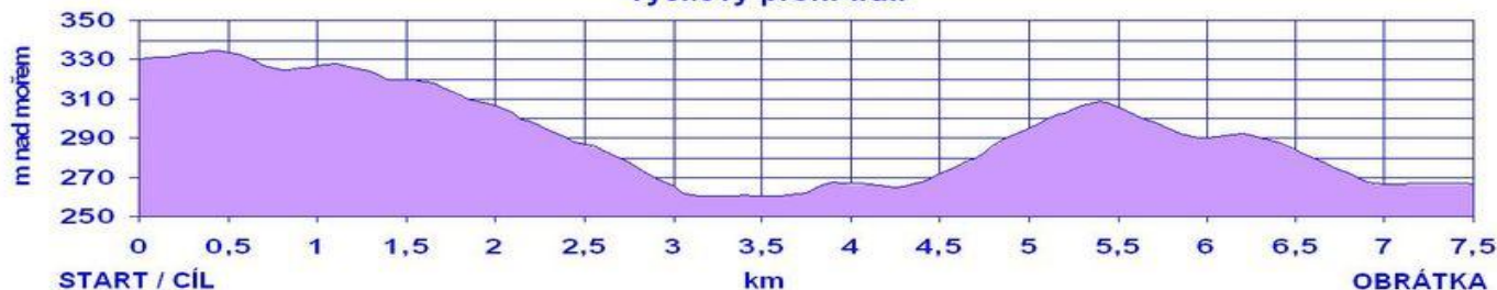
Výškový profil trati